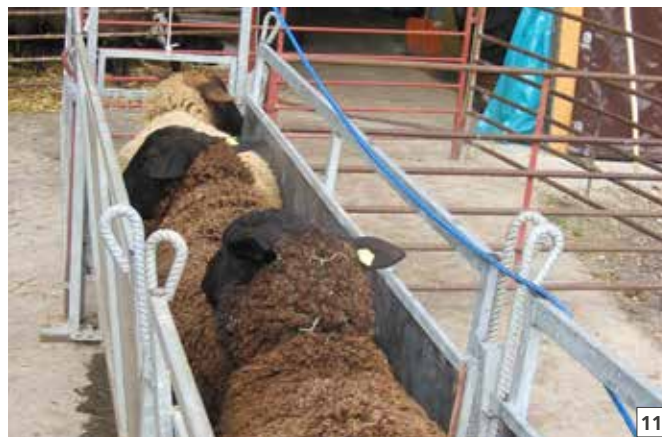
11 Bagno degli unghielli: bagni di sosta per 5 a 10 minuti.

Va notato che la soluzione per il bagno Desintec® Hoofcare Special D deve essere preparata nuovamente per ogni bagno. Inoltre, le pecore dovrebbero fare il bagno anche due volte alla settimana, se possibile. Per il risanamento della zoppina con Desintec® Hoofcare Special D, sono necessari in media 12 bagni.