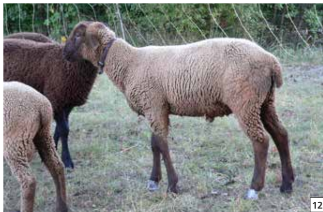
12 Bendaggio: Solo in casi eccezionali.

Se nel gregge non è presente il batterio Dichelobacter nodosus è impossibile che l'effettivo si ammali di zoppina. Per moltiplicarsi il batterio ha bisogno dell'unghiello e nei pascoli non sopravvive più di quattro settimane.