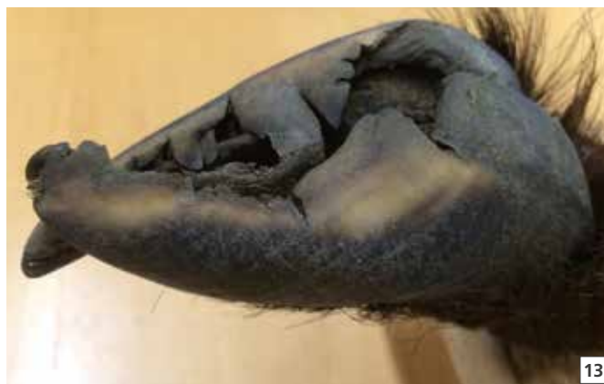
13 Scatola cornea di uno stambecco affetto da zoppina.