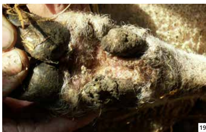
18 Sintomi di malattia della lingua blu