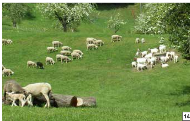
14 Se tenute con le pecore, anche le capre devono essere sottoposte a trattamento.